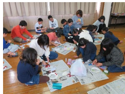
令和元年度の教室の様子

5月22日（土）から年10回開催を予定しておりましたが、前述のパソコン教室と同様の理由で、開催を見合わせています。開催の目途が立ったら、事前に保護者説明会を開いて開催することになっています。