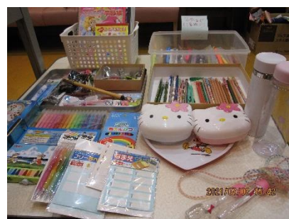
お持ち帰り品の一部