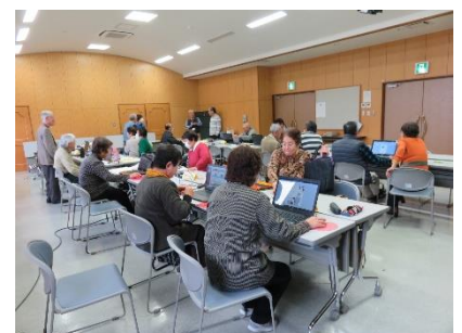
令和元年度の教室の様子

時津町社会福祉協議会との共催事業「アミーゴサロン」と当法人会員対象の「こみとぎピーシーサロン」は、日本の各地で新型コロナウイルス感染症の「緊急事態宣言」や「まん延防止等重点措置」が発出されており、長崎県の感染状況も増減を繰り返し、予断を許さぬ状況にあることから、開催（参加者募集）を見合わせております。