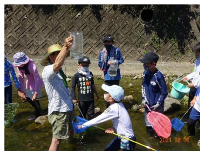
時津公民館主催行事