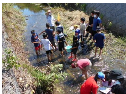
三重地区公民館主催行事