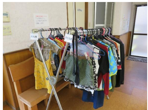
お持ち帰り展示品の一部