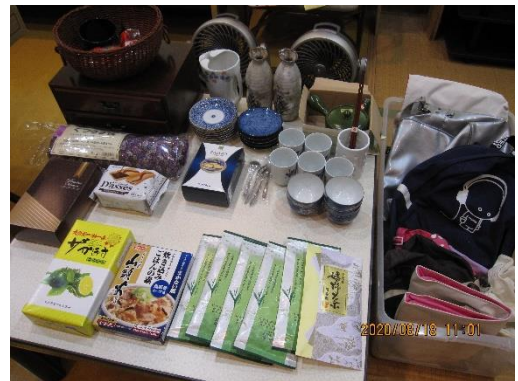
お持ち帰り展示品の一部