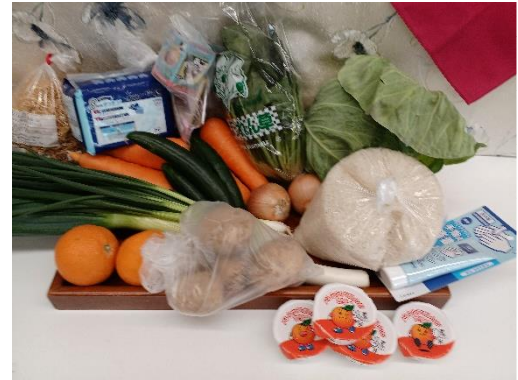
3月19日に提供した食料品