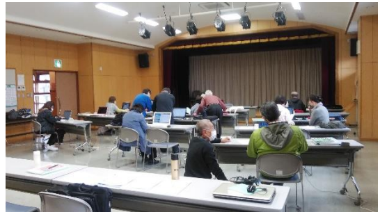
アミーゴサロンの様子

従来は応募者全員を受け入れていましたが、定員を15人とし、マスクの着用、手指や机・椅子のアルコール消毒、検温、ソーシャルディスタンスの確保、大声で話さないなどのコロナ感染予防対策を講じての2年ぶりの開催でした。