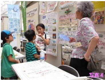
西彼地区推進員のコーナー