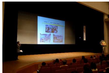
コミュニティ時津の活動報告