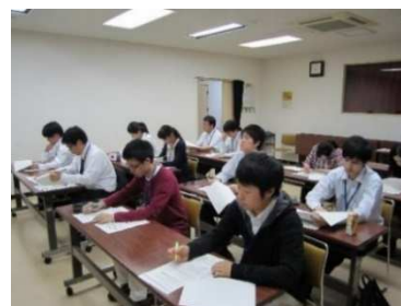
メモを取り熱心に聴く受講者

ボランティアに参加するきっかけ」となることを目的に実施された。講座の内容は、第1