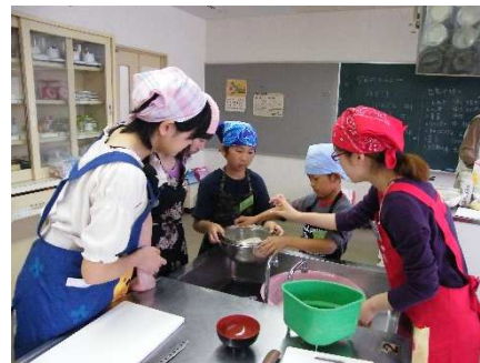
アドバイスする調理補助の学生スタッフ

教室を開催。子どもは調理実習8回、野外体験教室3回、合計11回の教室に参加する。