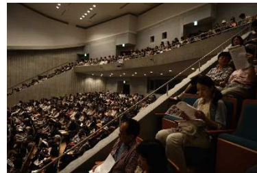
客席は2階席まではほぼ満席

7月から新体制に なった関係で「10 周年記念事業 検 討・推進チーム」 を立ち上げたのが 11月。その後、6回の実行委員(12人)会議 を開き、チラシ、ポスターの作成や公布、プ ログラムの作成、当日対策などを打ち合わ せ、年度をまたいでの開催となった。