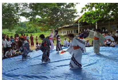
ブルーシートの上で日舞

民踊を披露しました。また現地の女性たちは、自立支援で身に付けた縫製技術を駆使して作った民族衣装や日本の浴衣を着てのミニファッションショーも披露、和やかな交流の