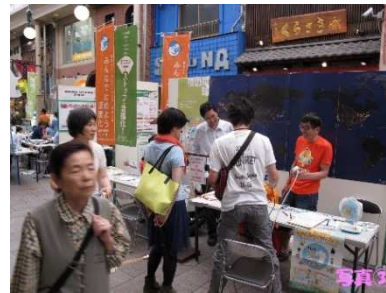
長崎地区推進員のコーナー