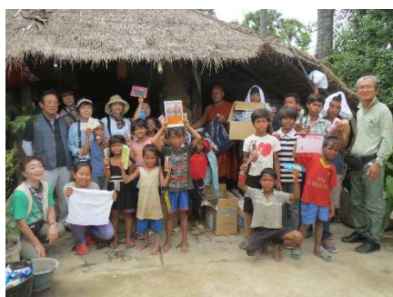
支援品を手にした子どもたちと記念撮影

今年 NP0 法人コミュニティ時津として 10 回目のカンボジア訪問になりました。訪問団も社会人 8 人と大学生 4 人の 12 人。