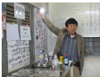
点検・整備を終えソーラー発電の灯りを確認

翌日はさらに 3 時間以上かかるノリア孤児院に向い、2 日間で様々な支援活動をしました。ここにも灌漑（かんがい）設備や農業用