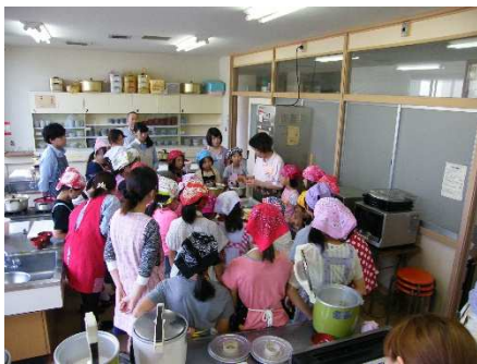
初回は野菜の切り方など基礎から教える

平成26年度の放課後子ども教室“いただきますクッキング教室”（エコクッキング）が5月10日（土）、北部コミセン教室からスタートした。