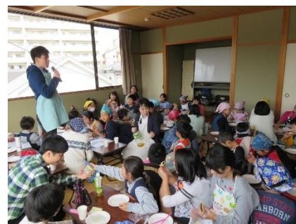
楽しかった大村すしづくり（四方八方から手が延びる）。会食と大学生スタッフの児童を送ることば。