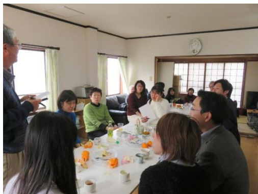
1 月 21 日の初回カフェの様子

前号で、「NPO 法人 らいぶながさき」主催で今年 1 月より時津町で「地域カフェ とき」を始めることをご紹介します。