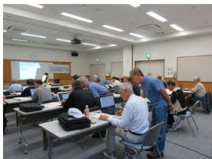
昨年の「やさしいパソコン教室」

時津町総合福祉センター（時津町左底郷）を会場に、10月と11月を除く第3火曜日（8月は第4火曜日）の午前9時半から11時半まで、年10回開催します。