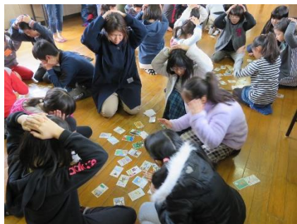
時津ふるさとカルタ大会

「福笑い」は、顔の部位と上下左右を英語で覚え、目隠しをした子がグループの子どもの英語の指示で、ドラえもんやアンパンマンの顔を完成させました。