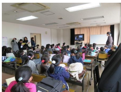
1年を振り返るDVDの放映