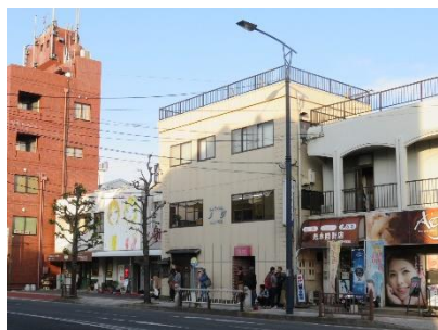
白壁のビル 3 階が会場

今後も耳寄りな話題提供なども行いながら、参加された方が「来てよかった」と思えるカフェにしていきたいと思っています。「地域カフェ とき」のことをいろんな方に周知していただいたり、食材・バザー品の提供、ボランティアで調理手伝いいただける方、大歓迎です。時津にまいた小さな種が大きく育つようにご協力・ご援助をお願いします。