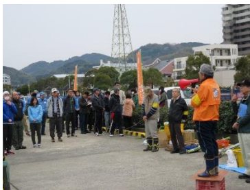
参加者全員ミーティング