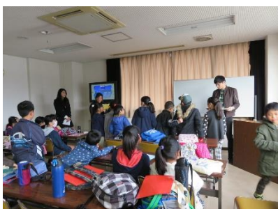
卒業（修了）証書授与式

今年度、最後のときつサタデールームは2月18日（土）、児童51人と世話役のスタッフ10人（うち大学生7人）、総勢61人が参加し、時津公民館で開催しました。