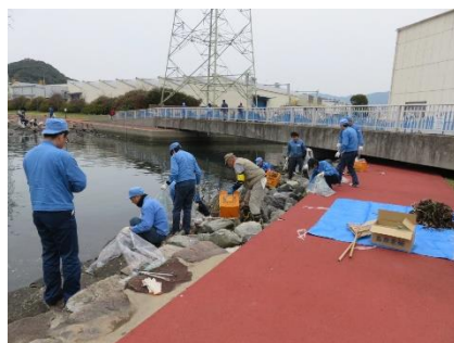
陸から漂着ごみを、海から浮遊ごみを収集