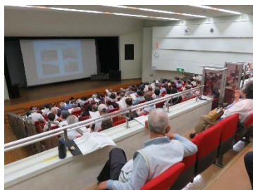
2階席からの会場の様子

ィ時津の立ち上げのきっかけや沿革、事業内容を話した後に、カンボジア支援の経緯や現状、支援内容、今後の支援方針などについて話をしました。