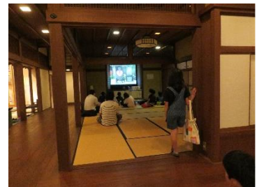
資料館で DVD の観賞