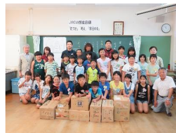
支援品を前に集合写真

人の参加者と児童、先生と一緒に梱包作業を行いました。終わりに、児童が募金活動で集めた寄付金が、児童代表から田窪理事長に渡されました。