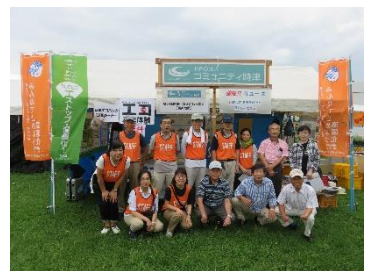
スタッフ全員で集合写真