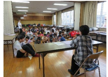
時津公民館別館でのお話

民俗資料館は、後藤学芸員の案内で見学しました。「継石坊主が教えてくれる時津街道」の DVD 鑑賞と「継石坊主、茶屋（本陣）」についての説明をした後に、「昔の時津を見てみよう」というテーマで、昭和 30 年代に撮影された古写真のスライドで、昔の町の様子を紹介しました。現在は家々やお店が立ち並んでいますが、かつては国道 206 号線沿いには田畑が広がっていました。町の発展とともに人口が増え、住宅やお店が立ち並び、現在の姿になっています」という話をされました。