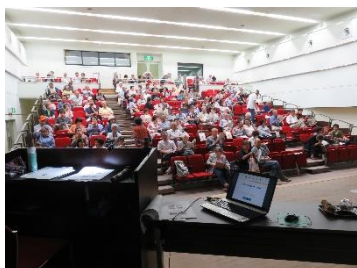
会場の時津公民館 講堂

法人の太田事務局長が「世界を知る『カンボジアの現状とボランティア活動』」というテーマで講演しました。講演では、NPO 法人コミュニティ