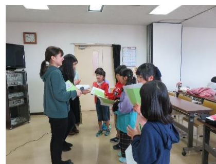
卒業または修了証書の授与