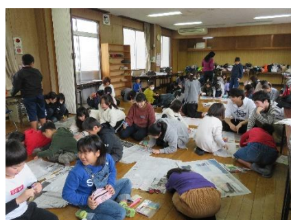
レジ袋に絵を描き ビニールテープの足とひもを付けて完成させた