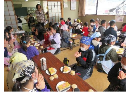
いただきます／ごちそうさまでしたは クッキング教室からのしきたり