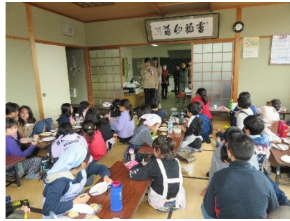
次年度もお世話になる 大学生スタッフのお祝いの言葉