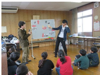
福笑いの遊び方の実演

新聞紙の兜作りは、長方形の新聞を正方形にし、中原スタッフの説明どおりに、順に折って完成させました。レジ袋を利用した凧作りは、レジ袋に思い思いの絵を描き、幅広ビニールテープの足と凧をあげるための糸ひもを付けて完成させました。その後、微風の屋外に出て自作の凧を手にとり、元気いっぱい走り回りました。