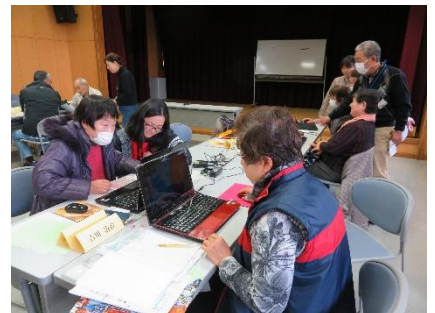
開講式からのサロンの様子