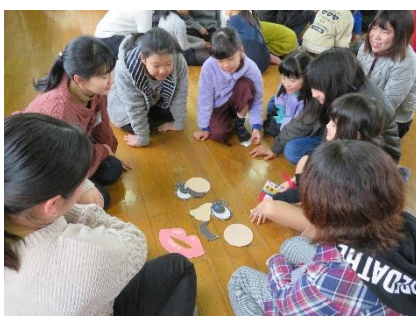
6～8人のグループに分かれて 英語で福笑い遊び