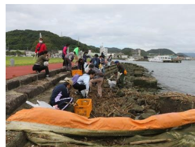
秋季（10/19）実施の一コマ