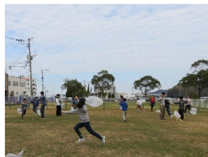
屋外で凧あげ大会