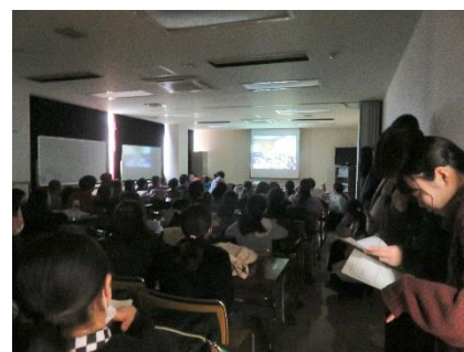
ふりかえりのDVDを見る