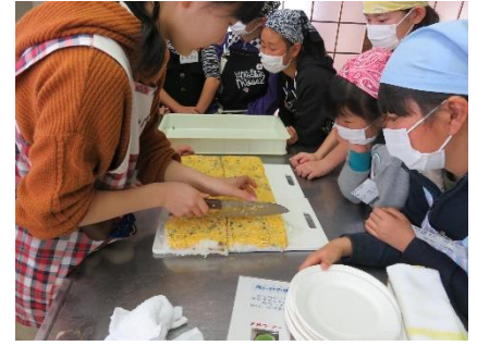
大村ずし作り：ご飯と具材は事前にスタッフが準備 作り方（手順）の説明を聞きながら完成させた