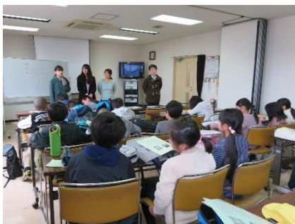
卒業する大学生（4年生）のお祝いの言葉と別れのあいさつ