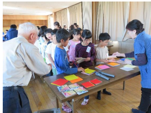
令和元年の「とぎつサタデールーム」 折り紙教室（日本の文化を学ぶ）

その後、コロナ第 5 波のピークに直面し、8 月末に「子どもの居場所づくり実行委員会」が中止決定をして、関係者の皆さんに中止のお知らせをしました。